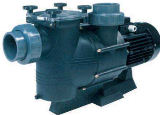
TABLA DE PRESTACIONES