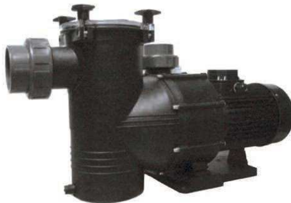
TABLA DE PRESTACIONES

TAPA PREFILTRO: En policarbonato, transparente, con sistema de cierre por palomillas CUERPO DE BOMBA: Material plástico de Polipropileno reforzado con fibra de vidrio y cargas minerales. EJE MOTOR: Acero Inox AISI 416 MOTORES: Protección IP55 POTENCIA: 4 CV - 5,5 CV VOLTAJE DE CONEXIÓN: 230/400 V - 50 Hz CONEXIONES: Aspiración Ø 90 mm - Impulsión Ø 75 mm (ambas con manguitos y racores de conexión incluidos)