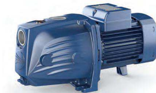
TABLA DE PRESTACIONES 2.900 rpm

CE, según normas EN 60 335-1, IEC 335-1, CEI 61-150, EN 60034-1, IEC 34-1 y CEI 2-3