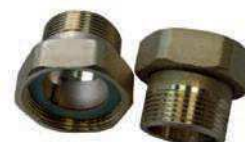
F/O - M/O