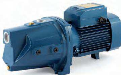
TABLA DE PRESTACIONES 2.900 rpm

CE, según normas EN 60 335-1, IEC 335-1, CEI 61-150, EN 60034-1, IEC 34-1 y CEI 2-3